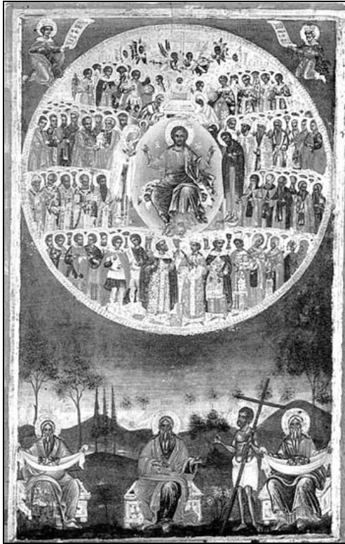
Ikone „Alle Heiligen“

ren Mysterien zur Erfüllung bringt. 108 Sie ist ein Mittel der Reinigung, die uns von aller Befleckung reinigt. 109 Sie ruft eine vollkommene Gemeinschaft zwischen dem Menschen und Gott hervor. 110 Sie „macht uns zu Verwandten Christi“. 111 Diejenigen, die aus diesem Leben scheiden, ohne die Heiligen Gaben empfangen zu haben, werden im anderen Leben nichts haben. Doch jene, die die Gnade empfangen und sie bewahrt haben, treten ein in die Freude des Herrn und in das Brautgemach. 112